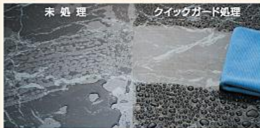
※人工大理石による撥水性・拭き上げ性テスト

表面の滑り性向上により、擦りキズを予防します。撥水性により、付着した汚れも簡単に除去できるようになります。また水切れもよく、拭き上げ性が向上します。